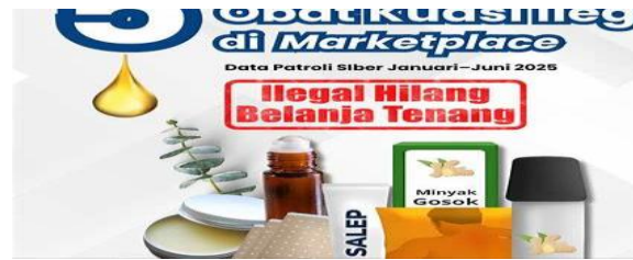
Gambar 2. Penjualan Produk Ilegal di E-Commerce Berdasarkan Temuan Patroli Siber BPOM (Januari-Juni 2025).

Berdasarkan hasil telaah terhadap peraturan perundang-undangan serta kajian literatur ilmiah dalam sepuluh tahun terakhir, penelitian ini menemukan beberapa konstruksi hukum penting mengenai pertanggungjawaban platform e-commerce dalam perdagangan produk ilegal dan palsu di Indonesia. Pertama, dari sudut pandang hukum dagang, marketplace dapat dikualifikasikan sebagai pelaku usaha. Undang-Undang Nomor 8 Tahun 1999 tentang Perlindungan Konsumen mendefinisikan pelaku usaha sebagai setiap orang atau badan usaha yang melakukan kegiatan usaha dalam bidang ekonomi. Marketplace menjalankan kegiatan komersial secara berkelanjutan, memperoleh keuntungan dari komisi transaksi, biaya administrasi, dan layanan sistem digital.