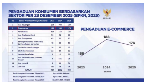
Gambar 1. Lonjakan pengaduan konsumen di sektor e-commerce dan lemahnya perlindungan konsumen digital di Indonesia sepanjang tahun 2023 – 2026

izin edar, tidak memenuhi standar keselamatan, serta produk tiruan yang melanggar ketentuan hak kekayaan intelektual. Peredaran produk semacam ini berpotensi merugikan konsumen dan bertentangan dengan prinsip perlindungan konsumen serta asas persaingan usaha yang sehat. Hasil penelitian Rizky et al. (2025) mengungkapkan bahwa marketplace dapat dimintai pertanggungjawaban hukum apabila terbukti tidak menjalankan kewajiban pengawasan secara memadai terhadap produk yang diperdagangkan melalui sistemnya.