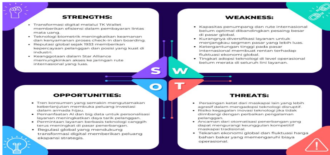
Gambar 2. Pembahasan SWOT Turkish Airlines

Dalam dunia industri penerbangan global yang terus berubah, Turkish Airlines menghadapi tantangan besar untuk bertahan. Teknologi disruptif seperti otomatisasi check-in , pembayaran digital, dan integrasi layanan berbasis AI telah mengubah ekspektasi pelanggan secara drastis. Meskipun Turkish Airlines telah memperkenalkan TK Wallet, langkah tersebut masih dianggap belum cukup signifikan untuk mendukung transformasi digital yang komprehensif. Kapasitas maskapai dalam merespons kebutuhan pelanggan yang semakin dinamis, seperti personalisasi layanan dan keberlanjutan, masih terbatas. Selain itu, kelemahan dalam adaptasi terhadap perubahan pasar, termasuk pengembangan rute internasional yang lebih kompetitif, menjadi hambatan signifikan untuk menjaga relevansi maskapai di pasar global. Jika Turkish Airlines tidak segera memperkuat transformasi digitalnya, maskapai berisiko kehilangan pangsa pasar kepada pesaing yang lebih inovatif seperti Lufthansa dan Air France-KLM, yang telah memimpin dalam mengintegrasikan teknologi modern ke dalam operasional (Četin & Benk, 2011).